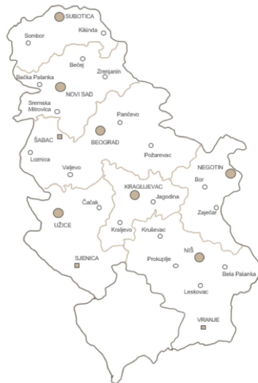
Slika 1. Teritorijalni prikaz mreže Centara za decu i porodicu

Kako bi se svoj deci koja se na godišnjem nivou izdvajaju iz porodica pružila podrška da nastave da žive sa svojim porodicama, kao i deci koja žive u institucijama da se vrate u svoje porodice, u o okviru plana transformacije ustanova za decu i mlade predviđeno je da kapacitet ovih radnih jedinica iznosi 756 porodica, a bilo bi zaposleno 74 pružaoca usluga. Iako se na ovaj način ne bi u potpunosti prevenirali rizici za izdvajanje dece iz porodica, država bi preuzela veću odgovornost za zaštitu dece i porodica koje su u riziku od izdvajanja iz porodice, odnosno dece koja žive u institucijama. Time bi se nedostatak razvoja usluga na lokalnom nivou donekle otklonio, a otpočelo bi se sa procesom preusmeravanja nacionalnih resursa sa podrške koja u sebi sadrži pretpostavku izdvajanja dece i napuštanje porodice, na jačanje porodice.